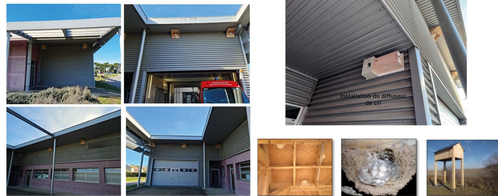
10 artificiels installés avec caisson de protection